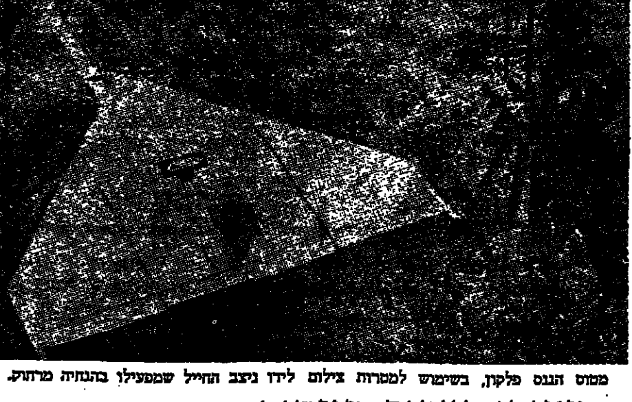
מסוט הגנוס פלקו, בשימוש למטרות צילום ליד נצב החיל שמפעיל בהנהגה מרוחה.

ראשי עדות המזרח מתארגנים לכינוס נוסף. ראשי עדות המזרח מתארגנים לכינוס נוסף. ראשי עדות המזרח מתארגנים לכינוס נוסף.